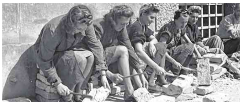
Frauen reinigen Ziegel in Wien: Aufnahme vom 17. August 1945

Aber die meisten notwendigen Arbeiten hätten Frauen allein mit bloßen Händen oder nur mit Schaufeln ausgerüstet gar nicht bewältigen können.