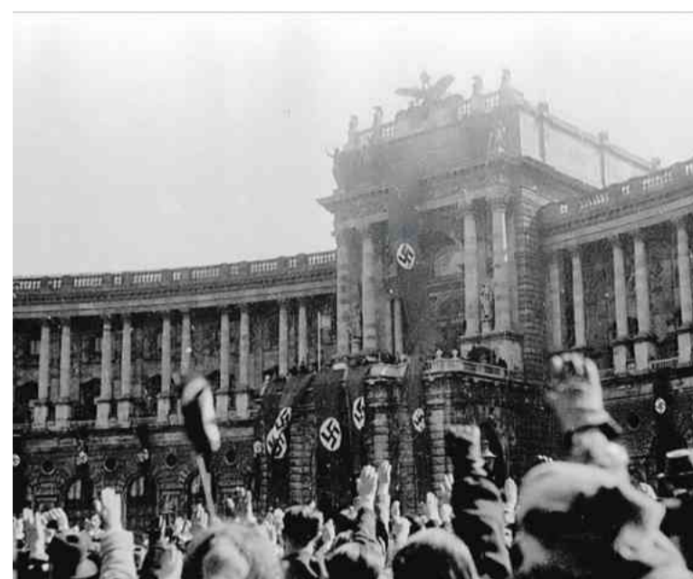
Heldenplatz, 15. März 1938: Hitler verkündet vom Balkon herab den Anschluss Österreichs an das Deutsche Reich unter frenetischer Begeisterung der Zuseher.

Weaner Charme in Moskau: „Und jetzt, Raab – jetzt noch d'Reblaus, dann sans waach!“ (Aus „Simplicissimus“.)