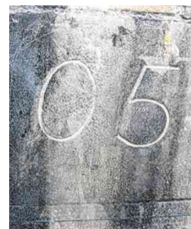
O5 ist das Kürzel einer Widerstandsbewegung, die ab 1944 aktiv war. 5 stand für den fünften Buchstaben im Alphabet, E, ergibt Ö für Österreich.

Ernsthaft quantifizieren lässt sich das Maß an Widerstand in Österreich nicht. Aber es gibt eine empirisch fundierte Studie,